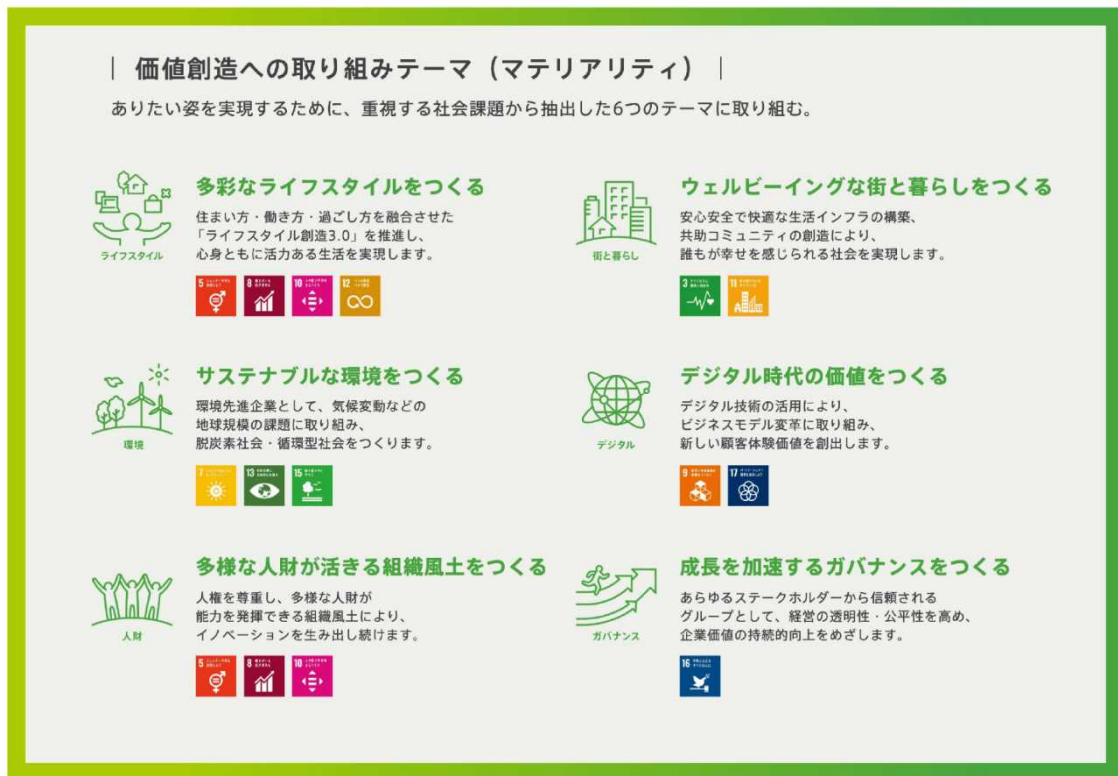
図表2：マテリアリティ

「GROUP VISION 2030」では、特定したマテリアリティを踏まえて長期経営方針を策定し、マテリアリティ毎に2030年度の目標を定め、目標達成に向けた取り組みを推進している。