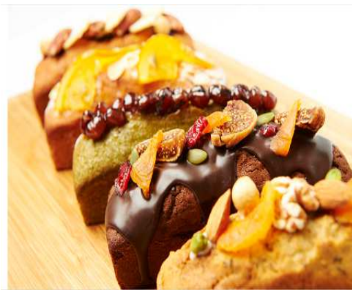
専任のパティシエが作るスイーツ