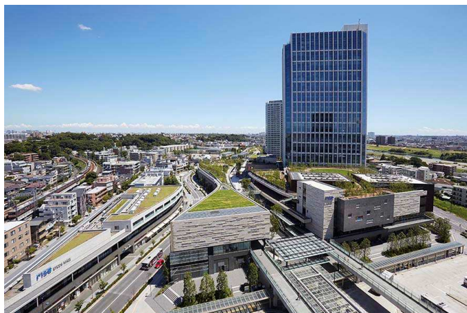
地域の生態系をつなぐ約6,000㎡のルーフガーデンを整備したほか、最新の環境配慮建築の手法に基づきグリーンビルディングへ取り組んでいる