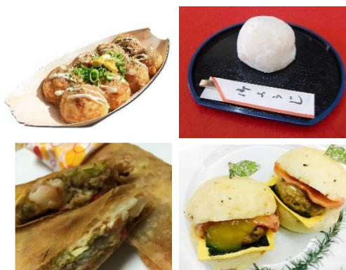
▲画像は、イメージです。