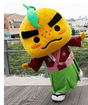
▲箕面の人気者 「滝ノ道ゆずる」くんも登場予定！

なお、今回の大会では、今年の「実生ゆず」の豊作を願い、箕面市の市立保育所・小・中学校の給食調理で出た野菜くずから作った箕面オリジナル「ゆずる完熟堆肥」を、お客様の投票数に応じて※、「止々呂美（とどろみ）ゆず生産者協議会」へ寄贈します。 ※お客様の投票数10票に対して、「ゆずる完熟堆肥」を1つの寄贈