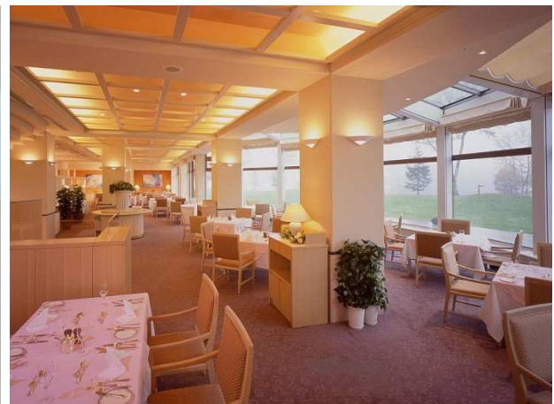
【レストラン・クレール】