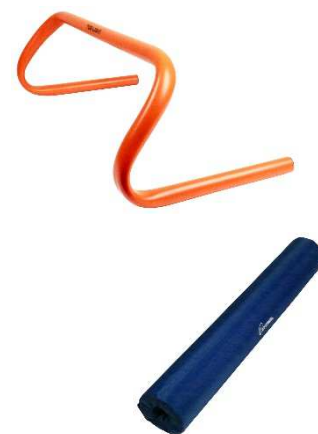
▲ 寄贈予定の「体育用具」 (上)ステップハードル(5個1セット) (下)サポートパッド