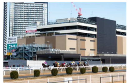
川崎競馬場内馬場からの外観