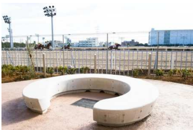
馬の蹄鉄をモチーフにしたベンチ