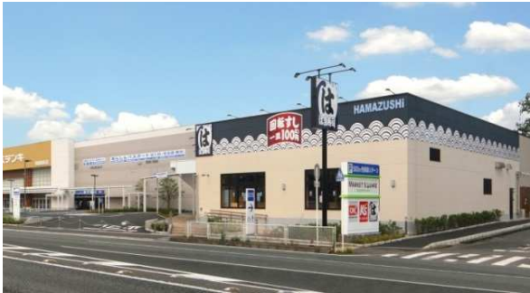
マーケットスクエア相模原(※)

マーケットスクエアは、現在、神奈川県相模原市の「マーケットスクエア 相模原(※)」、愛知県名古屋市の「マーケットスクエアささしま」、兵庫県宝塚市の「マーケットスクエア中山寺」などで展開をしております。