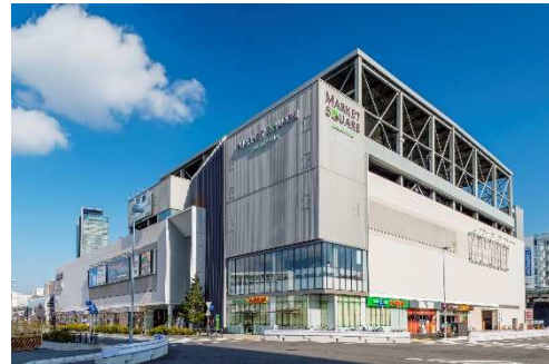
マーケットスクエアささしま

※マーケットスクエア相模原は東急不動産が開発し、現在はアクティビア・プロパティーズ投資法人が保有する運用物件です。