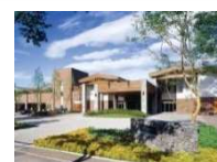
選べるホテルハーヴェスト 1泊2食付ペア宿泊券