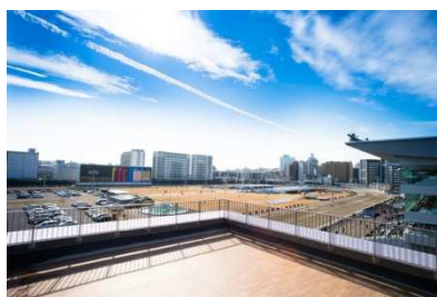
4F駐車場テラスからの眺望