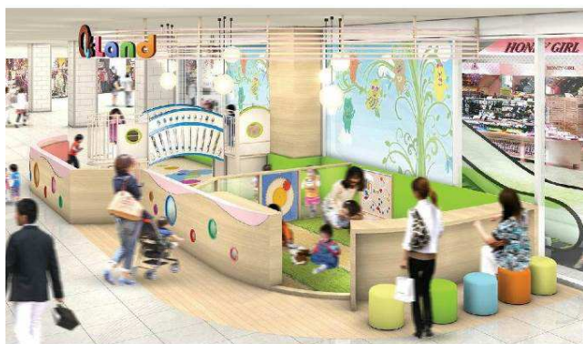
キューズランドイメージ