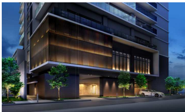
カーアプローチ完成予想図