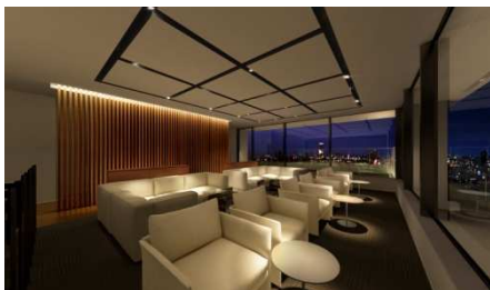
スカイラウンジ完成予想図