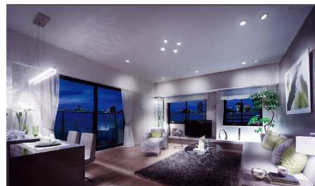
モデルルーム写真(Htype71.23㎡)