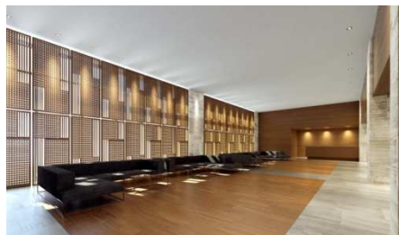
オーナーズホール完成予想図