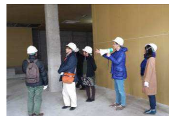
▲ サポーター会議の様子