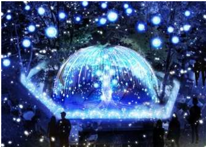
「おもはらの森」クリスマスイルミネーション ※画像はイメージです

このたび、6階屋上テラス「おもはらの森」で展開するイルミネーションの詳細や各ショップのクリスマスおすすめアイテム、豪華プレゼントが当たるキャンペーンの内容が決定しましたのでお知らせ致します。