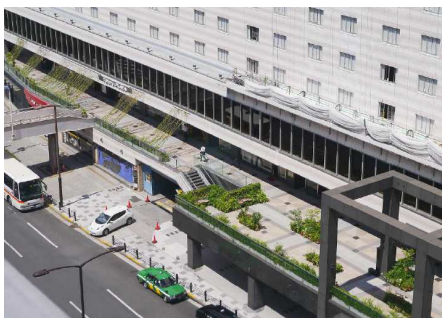
オープンコリドールの全景

本件の「クライムサポート」誘引緑化工法は、植物が絡まりやすい材料と形状で、より速やかな帯状の誘引緑化を可能としており、低コスト、低荷重による緑被率の最大化も実現している。「バイオキューブ」は、多面植栽が可能な立体緑化基盤であり、在来種の山野草を中心に上部には野趣に富んだ中低木をアクセントにした多品種混交植栽を行い、季節感豊かな潤いのある景観を創出している。特殊基盤での環境適性植物調査を行うなど、「野に咲く花の回廊」を実現する維持育成管理を実施している。既存建築物における、公道に接する歩行空間への緑化の導入事例は稀である。公共性の高い空間の緑化であり、四季を通じて草花で歩行者を楽しませる工夫などが高く評価された。