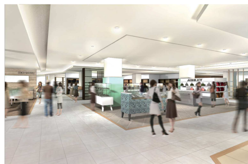
バラエティに富んだ店舗が揃い 利便性が向上した2Fフロア

「東急プラザ 蒲田」は、1968年の開業以来、46年間地域の人々に親しまれて営業してきた商業施設です。約25年振りとなる今回のリニューアルでは、「誰だって、新しくなれる。」というコンセプトのもと、駅ビルに求められる利便性の向上を図り、ファッション性・日常性を兼ね備えたライフスタイル提案型施設に新しく生まれ変わります。