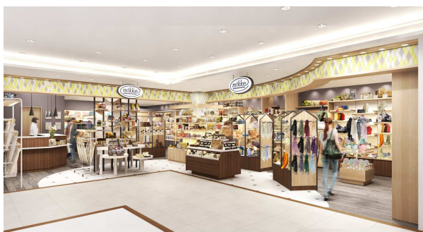
東急百貨店初の服飾雑貨専門店 「mikke by Tokyu Department Store」