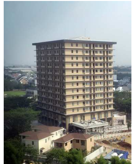
<アクシア・サウスチカラン外観>

名称 : AXIA SOUTH CIKARANG アクシア・サウスチカラン 所在地 : ブカシ県リッポーチカラン地区 (ジャカルタ中心部から約 40km) ※周辺地図ご参照 敷地面積 : 約 7,000 m 2 客室数 : 180 室 タワー (地上 13 階建て) 177 室 戸建 (2 階建て) 3 戸