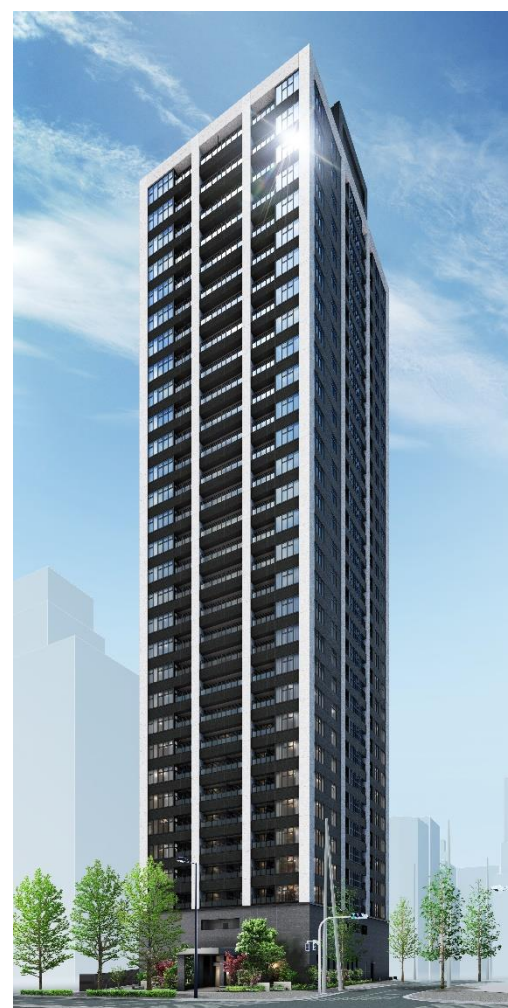
「外観」イメージパース

両社は今後も事業を通じた社会価値を提供するとともに、快適な住まいづくりに努めて参ります。