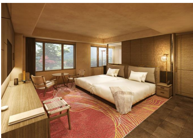
スタンダード客室イメージ

本施設が出店する「京都東急ホテル東山（以下「本件ホテル」）」は、元京都市立白川小学校跡地活用計画のホテル施設として位置付けられております。文化・芸術施設が多く集積する京都・東山に位置する本件ホテルは、和の美しさと現代的な機能性の両立を追求した客室、中庭や京都に根差した本物の文化に触れる体験アクティビティなど、滞在することが目的となる、このホテルならではの時間が流れる空間を演出します。すべての客室に独自制作の「茶箱（オリジナルの茶器ひと揃え）」を設置し、日本茶を茶葉から淹れて楽しむことを通じて、茶文化の一端に触れることができるなど、様々な体験が可能な施設となる予定です。