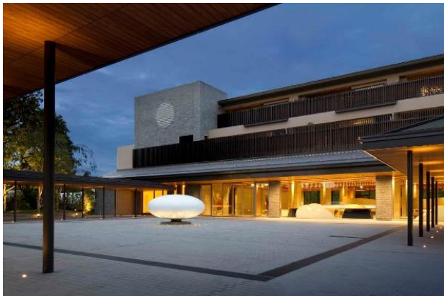
東急ハーヴェストクラブ京都鷹峯&VIALA

東急不動産ホールディングスグループでは京都を重点エリアと位置付けており、東急ハーヴェストクラブとしては本施設や「東急ハーヴェストクラブ京都鷹峯&VIALA」。パブリックホテルとしては今年 9 月に開業した「ROKU KYOTO, LXR Hotels & Resorts」や、「東急ステイ京都三条烏丸」(2017年11月開業)、「東急ステイ京都阪井座(四条河原町)」(2018年12月開業)、「nol kyoto sanjo」(2020年11月開業)がございます。様々な需要を捉え、今後もお客様に満足いただける施設を提供してまいります。