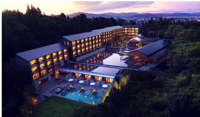
ROKU KYOTO, LXR Hotels & Resorts