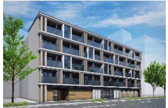
キャンパスヴィレッジ京都衣笠（外観）

住 所：京都府京都市北区衣笠東御所ノ内町43番 交 通：京福電鉄北野線「北野白梅町」駅 徒歩21分 総 戸 数：138室