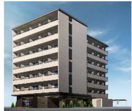
キャンパスヴィレッジ京都今出川通（外観）

住 所：京都府京都市上京区今出川通浄福寺西入二丁目東上善寺町173番他 交 通：京都市営地下鉄烏丸線「今出川」駅 徒歩18分 総 戸 数：66室