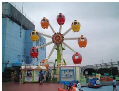
2代目「グレ太の観覧車 フラワーホイール」 (1989～2014年)