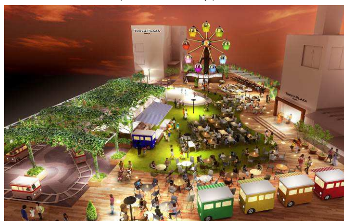
2014年10月～ リニューアルオープン後 屋上イメージ