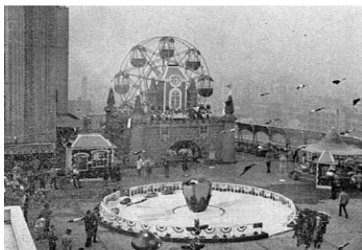
初代 通称「お城観覧車」 (1968～1989年)

この度、「東急プラザ 蒲田」に復活する「屋上観覧車」は、1968年に設置され、「東急プラザ 蒲田」が一時閉店した2014年3月までの46年間、地域の人々に愛され続けてきました。初代の通称「お城観覧車」から、1989年に二代目の「グレ太の観覧車 フラワーホイール」にバトンタッチし、今日まで親子三代のお客様にご利用いただくなど、多くのお客様に楽しい思い出をお届けしてきました。そして、都内で唯一現存する屋上観覧車となり「蒲田のランドマーク」として全国にも知られていました。今回復活する観覧車はカラーリングも新たに、さらに幅広い皆様に親しまれることを目指します。