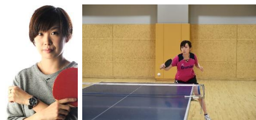
7月開催予定の「卓球サーブのなぞ」(仮)