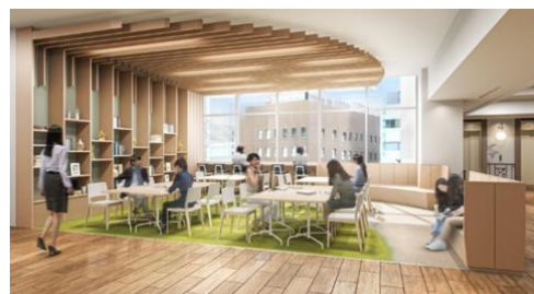
「つどいのひろば」完成イメージ

アフターコロナを見据えたギャザリングスペースとして、2021年7月1日（木）（予定）に「つどいのひろば」を新設します。プロフェッショナルとの交流でお子様に気づき・学びを与える「プロQ学園」などのイベント開催場所として、地域の「交流」「つながり」を育む場所を目指します。また、イベント開催時以外には、地域の人々の交流スペースやリモートワーク・勉強スペースとして自由に利用頂けます。