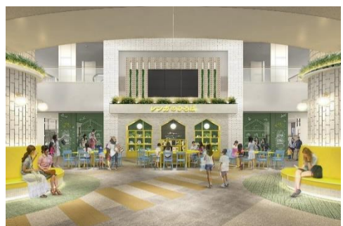
「レンガのひろば」完成イメージ

地域の人々がつどうラウンジのような空間として、2021年7月20日（火）（予定）に3階「レンガのひろば」に生まれ変わります。「交流」「つながり」を育むコミュニティスペースとなるべく、ワークショップ型イベントや座談会などを定期的に企画・実施することで、新たな学びを発見できる場を提供していきます。また、イベント開催時以外は、施設を訪れる人々が時に憩い、時に学び、時に遊べる環境を整えることで、地域の人々に愛され、気兼ねなく立ち寄って頂ける場を目指します。