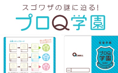
参加者に配布される生徒手帳

詳細は決定次第、施設ホームページにて告知します。 URL： https://qs-mall.jp/abeno/event/