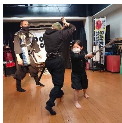
「サムライニンジャアクションのなぞ」