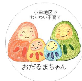
「わくわく子育ての会“ハグミー”」 (あまがさきキューズモール)