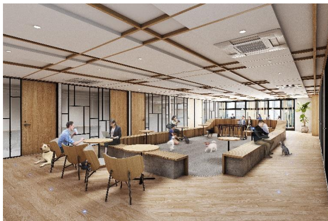
4階ペット同伴可能シェアワークプレイス（イメージ）