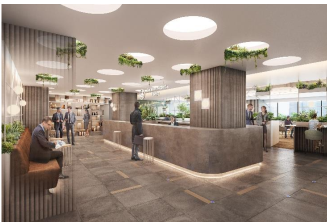
BA 日比谷 シェアワークプレイス（イメージ）

この度開業するBA 日比谷は、商業集積地に所在する東宝日比谷ビル(日比谷シャンテ)内に出店し、プライベートと仕事の垣根を更にフレキシブルにした、働く場を提供いたします。また、BA 京橋はホテル用途として活用されていた建物を改装します。その多層階という特徴を活用し、通常のBAでのオフィス機能に加え、ペット同伴可能なフロアやDIYスペースを併設するBA初となる新しいサービスを取り入れます。多様な働きかたを検証する実験店舗として、時代のニーズに合わせたオフィスを検討し、提案します。