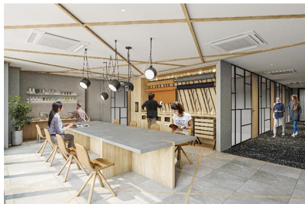
6階・8階DIYスペース（イメージ）