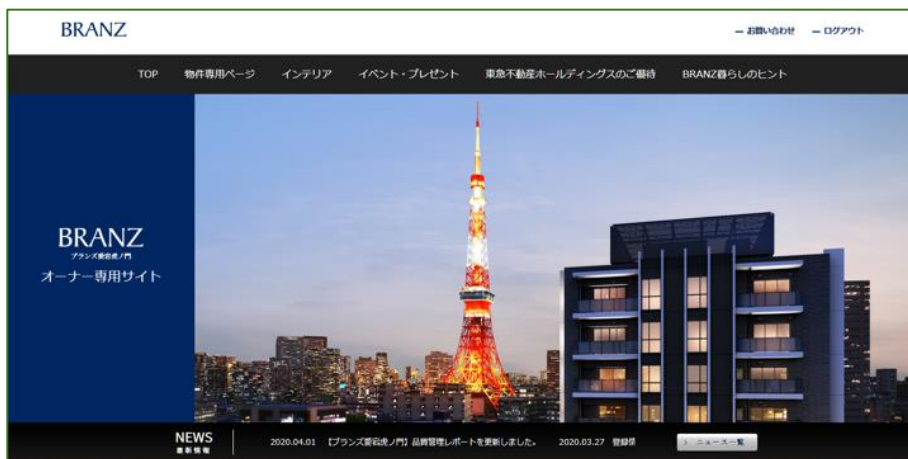
「オーナー様専用ページ」