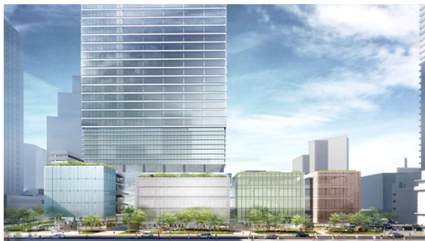
複合施設 A 低層部外観（南側）