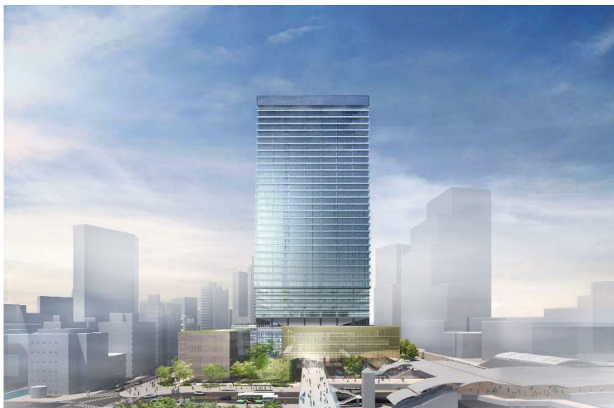
複合施設 A 全体外観（東側）