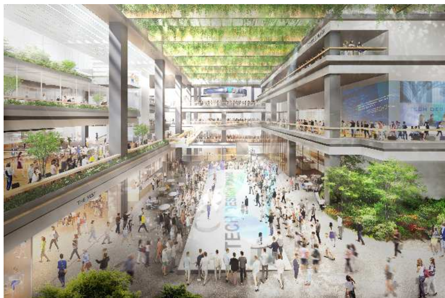
複合施設 A 低層部内観

※完成予想イメージは計画段階のものであり、今後の協議などにより変更となる可能性があります。