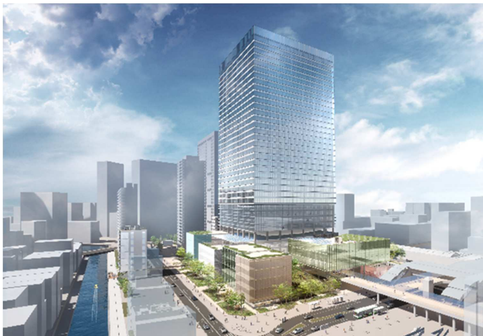
複合施設 A・複合施設 B（完成予想イメージ）

今後は、東京工業大学と連携を図り、工業デザイン発祥の地である本事業敷地において、国内外の企業・大学が集積する産業・研究拠点の整備を行うとともに、新たな都市像となる「イノベーション・ウォーターフロント」の実現に向けて、田町エリアの街づくりを推進してまいります。