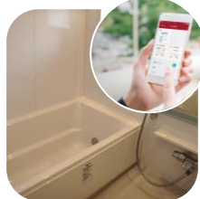
お風呂の お湯はり・追い焚き