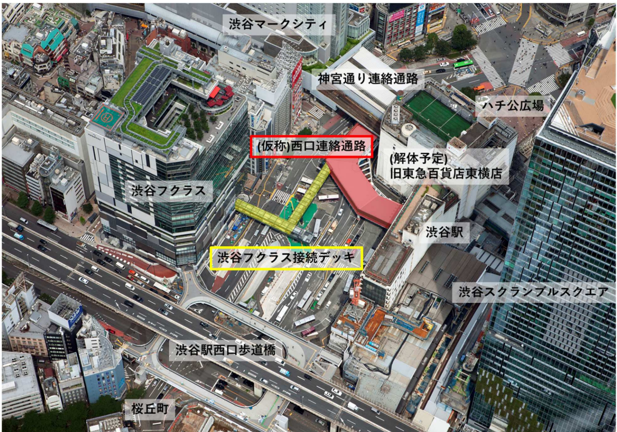
歩行者デッキ全体図