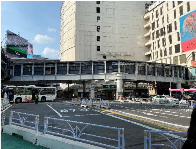
(仮称) 西口連絡通路