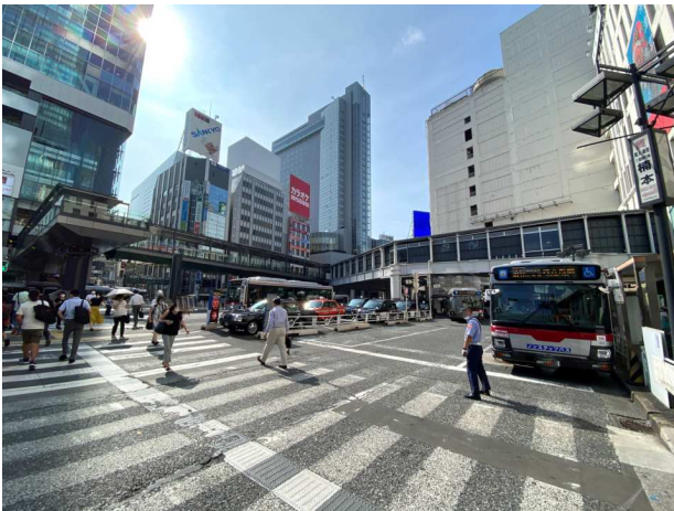
歩行者デッキ全景（渋谷駅方面から見る）