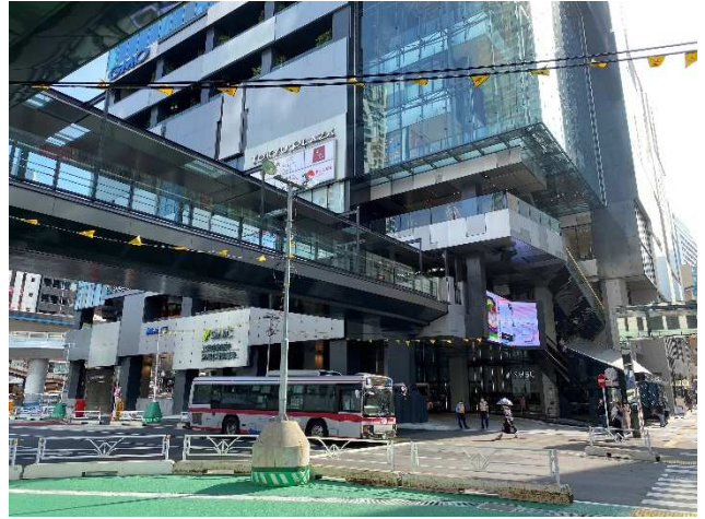
渋谷フクラス接続デッキ