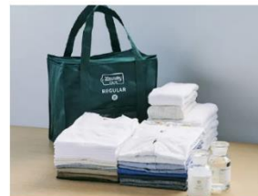
丁寧に梱包してご自宅まで お届け