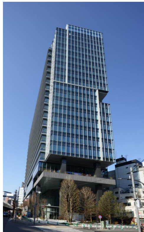
渋谷ソラスト外観