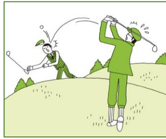
他人への賠償責任補償