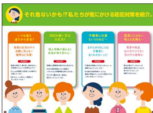
キューズモールオリジナル防犯ブック