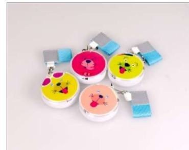
キューズモールオリジナル防犯ブザー

東急不動産ホールディングスでは、事業活動を通じて社会課題の解決に取り組み、お客様や社会に新しい価値を提供しています。本プロジェクトは、「キューズモール」のブランドスローガン「街は、おおらか。人は、ほがらか。」を実現する取り組みとして地域一体となってエリアの活性化を目指す、4施設合同「キューズモールスマイルプロジェクト」として2013年10月より開始し、これまで地域の皆さまと様々な活動を行ってまいりました。2020年度もスマイルプロジェクト第12弾「みんなのポイントで地元の新一年生に防犯ブザーを贈ろう！」を2020年3月1日より1年間実施し、地域の皆さまと共に、子供たちの安心・安全と、防犯意識の向上により誰もが安心して暮らし、訪れることのできる街づくりをめざし、地域に愛されるサステナブルな商業施設を目指します。