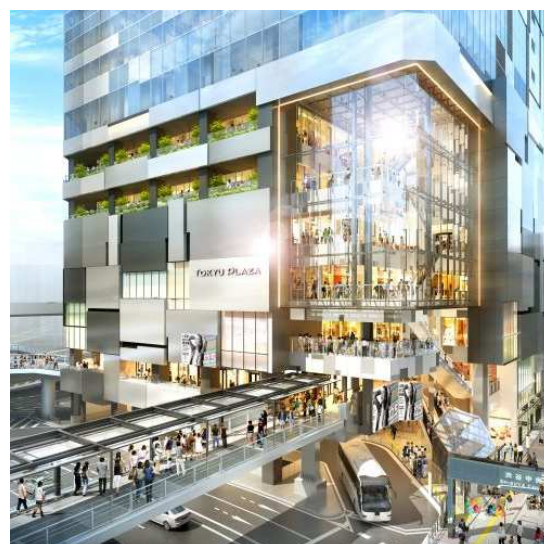
東急プラザ渋谷 外観イメージ

事業主体 東急不動産株式会社 所在地 東京都渋谷区道玄坂一丁目2番3号 地上2階～8階、17階、18階 （渋谷フクラス内） 交通 JR各線 渋谷駅南改札西口 徒歩1分 設計・監理 清水建設株式会社一級建築士事務所 商環境デザイン 株式会社グラマラス 施工 清水建設株式会社、株式会社乃村工藝社 施設運営 東急不動産SCマネジメント株式会社 開業日 2019年12月5日（木） 営業時間 物販・サービス店舗 10:00～21:00 飲食店舗 11:00～23:00 17階屋上テラス 11:00～23:00 （最終入場22:30） ※一部店舗は異なる 定休日 1月1日（予定） ※一部店舗は異なる 店舗数 69店舗 公式HP https://shibuya.tokyu-plaza.com/