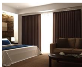
カーテンの自動開閉