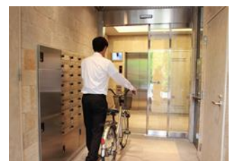
顔認証によるオートロック解除