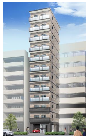
リバーレ日本橋三越前 イメージパース