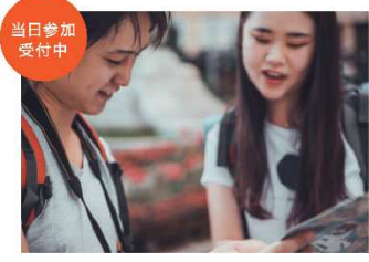
※詳しくは受付会場にて

地図をもとに、神社、寺院、動物園など、アベノ・天王寺の様々な場所を制限時間内に回り、得点を集めるスポーツです。