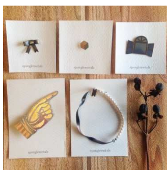
天王寺のお店 きになる舎