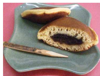
阿倍野のお店 御菓子司亀屋茂廣