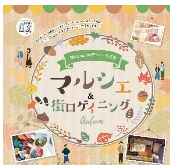
マルシェ&街ロゲイニング キービジュアル