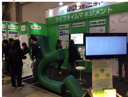
第1回 施設リノベーション EXPO の様子