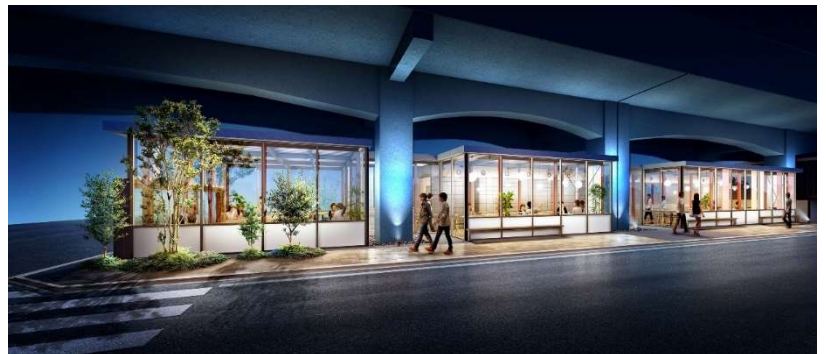
食堂/カフェテリア イメージ(L棟)