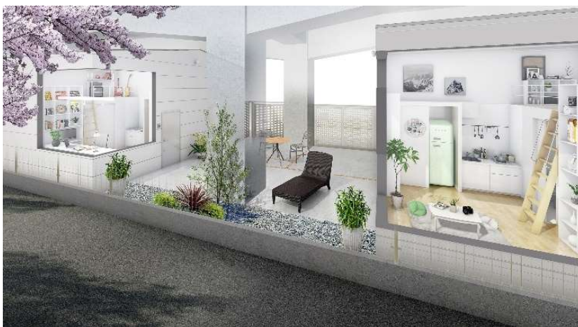
C棟(Studio タイプ)イメージ