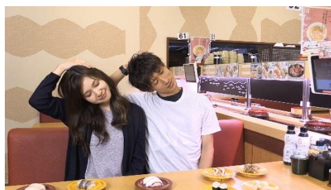
【たこ“首”脱力】 傾けすぎた首をたこのように脱力

また、スシローではお腹を満たすだけでなく、身体も癒していただくことをより積極的に促進する為、SNS キャンペーン『すしフォト』の仕組みを活用したキャンペーンを実施します。スシロー店内外でストレッチをしている写真及び動画を『Twitter』もしくは『Instagram』でハッシュタグ「#スシレッツ」をつけて投稿していただくと、抽選で30名様対象に景品が当たるキャンペーンを開始します。