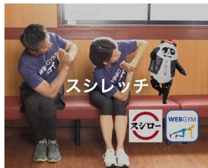
② スシレッチ イメージ