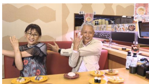
【鯛“肩甲骨”ストレッチ】 レーン側の方は活かした腕を肩甲骨から癒そう