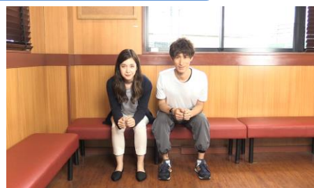
【サーモン“お尻”ストレッチ】 安定人気のサーモンのようにお尻周りも安定