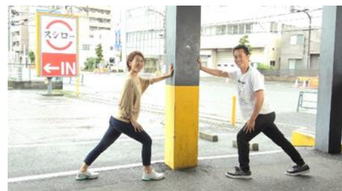
【えんがわ“下半身”ストレッチ】 背びれから脚を引き締める