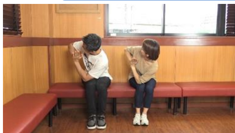
【マグロ“ウエスト”ストレッチ】 マグロのように腰をしっかり回遊