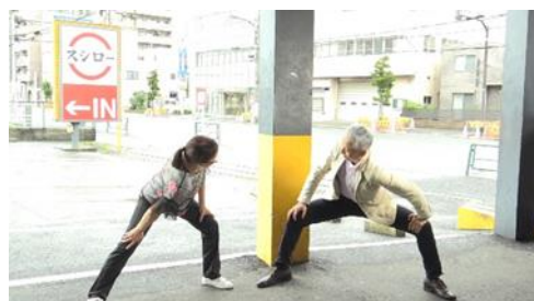
【真さば“股関節”ストレッチ】 股関節をグッとスー(酢)っと伸ばす