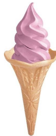
ラベンダーソフト

ほかに、今年はヨーロッパで400年以上の歴史をもつ伝統的アート「インフィオラータ」が新登場。花びらとカラーサンドを使用して創り上げられており、新たなインスタ映えスポットとして、ひまわりガーデンや、「英国チェルシーフラワーショー」で金賞を受賞し続ける世界的な庭園デザイナー・石原和幸氏がプロデュースする「アニマルトピアリー」と合わせてお楽しみいただけます。