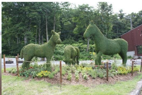
アニマルトピアリー