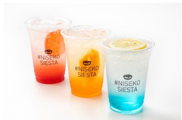
(画像左から) アンヌプリサンセット (トマト)、羊蹄サンライズ (メロン) ヒラフスカイソーダ (ラムネ)