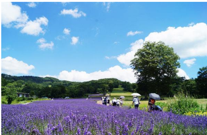
たんばらラベンダーパーク