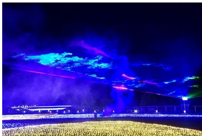
ジオ・イルミネーション

その他にもセグウェイ体験や標高1,000mの高原ならではのパラグライダー、ゲレンデを利用した芝そり、恐竜をテーマにした子ども向けのパーク「わんぱく恐竜ランド」など、家族連れでもお楽しみいただけます。