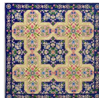
たんばら花のキルト展