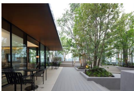
21階の「スカイテラス」

新しいオフィスでは働き方改革や多様なワークスタイル（新しい働き方）をサポートするため、IoTを活用したスマートオフィスを計画しています。最上階の屋上空間を活用して「スカイテラス」を設け、ワーカーのストレス軽減を図るなどの対応も進めます。東急不動産HDと東急不動産ではこのビルで自ら「働き方改革」や「効率的なオフィスづくり」による生産性の向上に取り組み、ノウハウを蓄積。そのノウハウを基にお客さまに更なる多様なワークスタイルを提案してまいります。