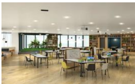
10階の「グループ拠点」(イメージ)