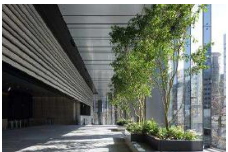
緑を配した2階「エントランス」