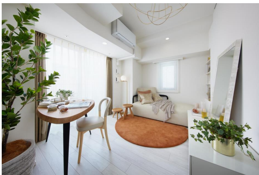
カラスキーム「NEUTRAL」のモデルルーム