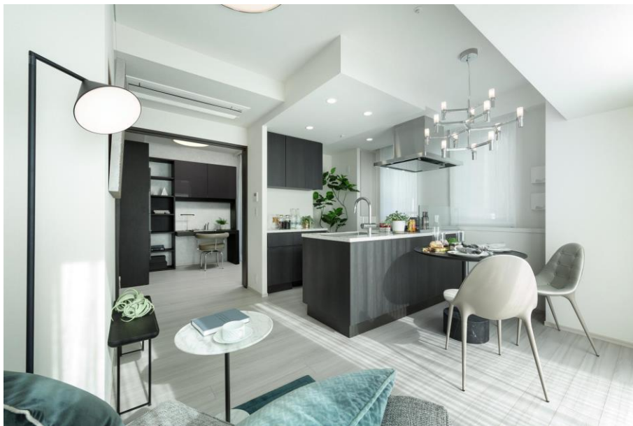
カラスキーム「ADVANCE」のモデルルーム

また、棟内モデルルームのコーディネートデザインもカッシーナ・イクスシーが担当し、来場者へその世界観を実生活に近い状況で体感いただくことができます。