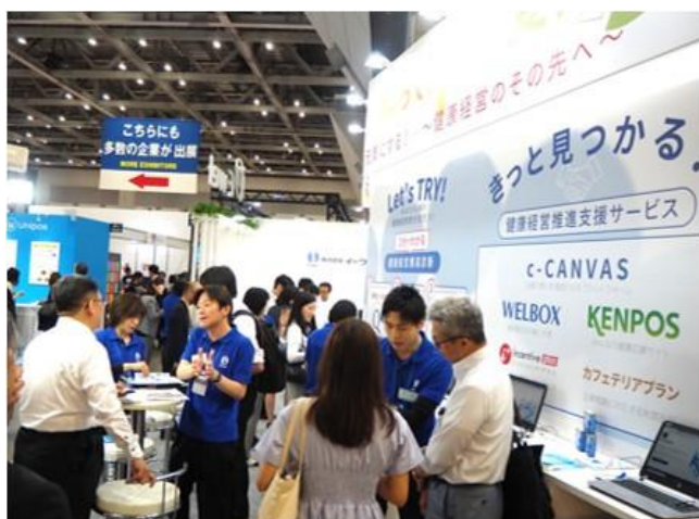
▲当社展示ブースの様子

HR EXPO を含む「総務・人事・経理ワールド」全体の来場者は、60,662名と大盛況となりました。当社展示ブースにお越し頂いた方々、ご挨拶させて頂いた方々には、深く御礼申し上げます。