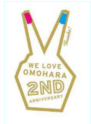
WE LOVE OMOHARA 2nd Anniversary ロゴ