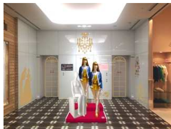
【3階エレベーターホール】 シンデレラのシルエットでダンスホールのイメージを演出