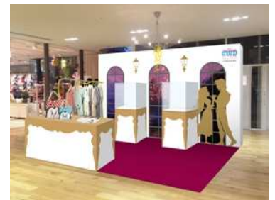
【5階エレベーターホール】 「塔の上のラプンツェル」の世界を表現