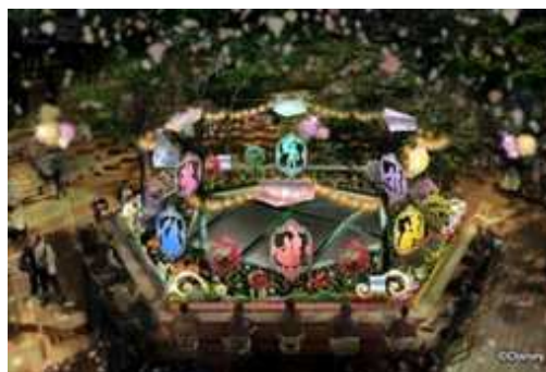
【6階屋上テラス「おもはらの森」】 中央の六角形のトップライトを中心に、6人のディズニープリンセスの物語をシルエットで表現。 夜(右)はライトアップされ、昼(左)とはまた違った表情が楽しめます