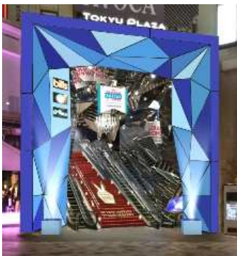
【1階エントランス】 シンデレラのドレスのカラーをイメージしたブルーのファサードと階段のレッドカーペット、シャンデリア調の吊りもので訪れたお客様を迎え入れます