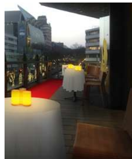
【3階テラス】 「美女と野獣」に出てくるテラスのイメージをシルエットで表現