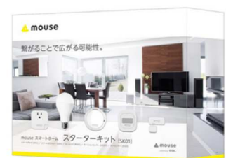
「mouse スマートホーム」 スターターキット イメージ

※スターターキット…ルームハブを中心とした、「mouse スマートホーム」5製品 ①ルームハブ②スマートLEDライト③スマートプラグ ④ドアセンサー⑤モーションセンサーをオールインワンにしたセットです。