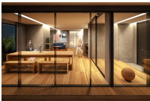
TOKYO CRAFT ROOM イメージ

一般開放するギャラリー、少しずつ変化をする客室という2つの要素を持つ特別な部屋「TOKYO CRAFT ROOM」。日本で行われている素晴らしいものづくりの技と精神が、新たな出会いや解釈を経て、この部屋から世界に、未来に向けて発信されます。