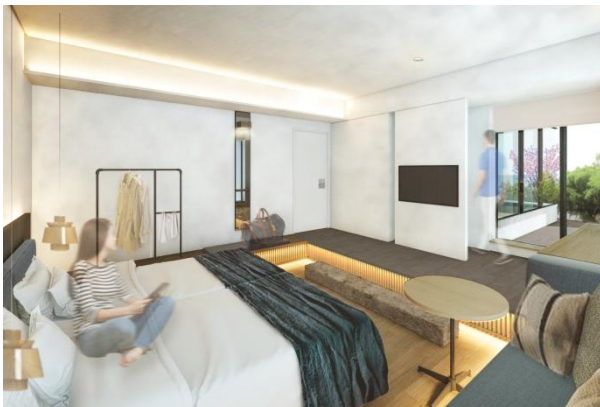
TERRACE ROOM イメージ