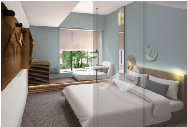
DOUBLE ROOM イメージ