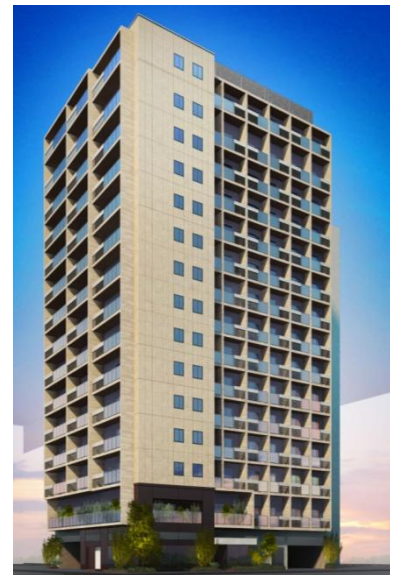
住宅側外観イメージ

カーペット張りの内廊下は、まるでホテルに住んでいるかのような、“非日常”を感じられます。