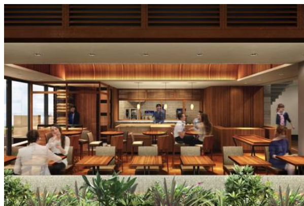
チョコレートショップイメージ