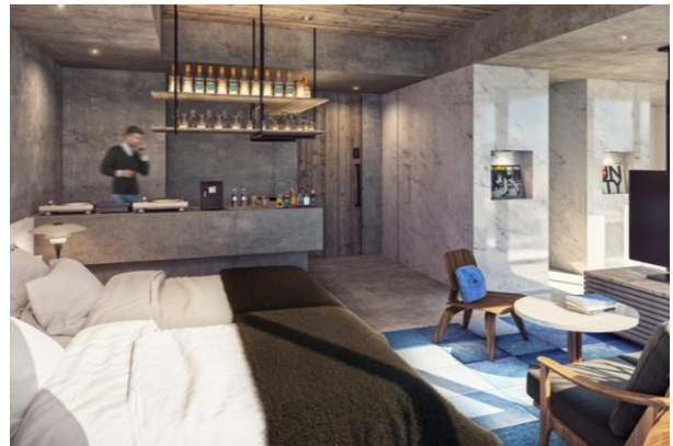
PREMIUM TERRACE ROOM イメージ