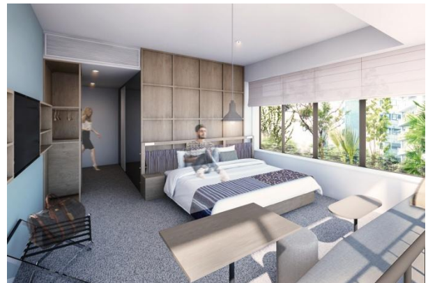
CORNER DOUBLE ROOM イメージ