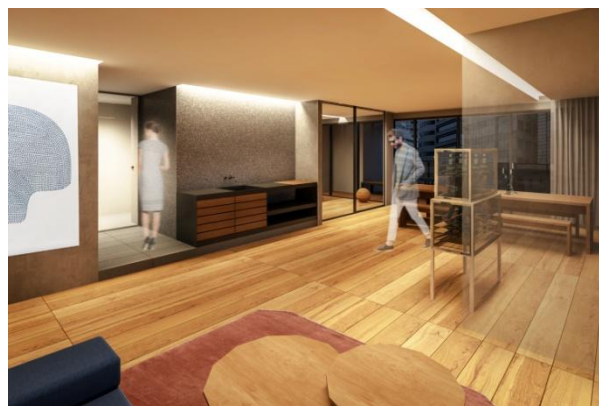
TOKYO CRAFT ROOM イメージ