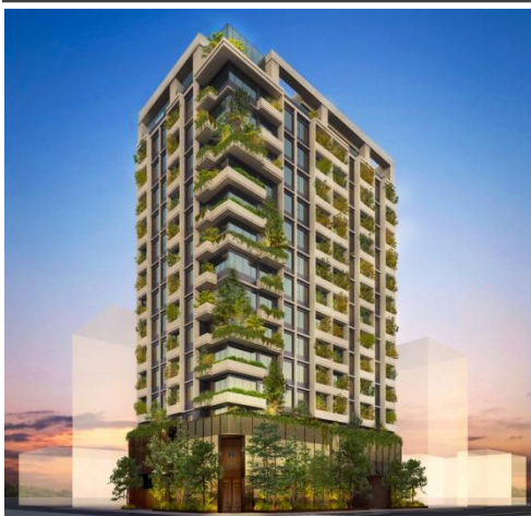
清洲橋通り側外観イメージ