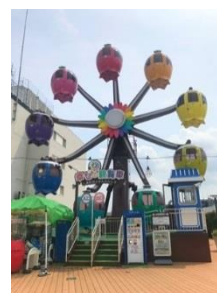
3代目「幸せの観覧車」 (2014年～)