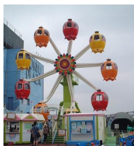
2代目「グレ太の観覧車 フラワーホイール」 (1989年～2014年)