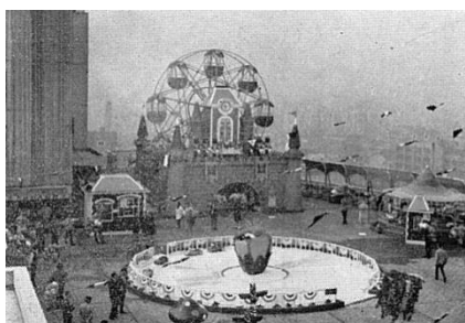
初代 通称「お城観覧車」 (1968年～1989年)

1968年に設置され、初代の通称「お城観覧車」から、1989年に2代目の「グレ太の観覧車 フラワーホイール」にバトンタッチし、今日まで親子三代のお客様にご利用いただくなど、多くのお客様に楽しい思い出をお届けしてきました。2014年3月にリニューアルのため一時閉店する際、閉鎖の危機を迎えましたが、皆様から存続を望む応援の声をいただき、2014年10月のリニューアルでは、カラーリングを新たに復活しました。ネーミング公募を行い、寄せられた全2,938通の中から、地域に『幸せ』を届ける願いを込めて「幸せの観覧車」に決定しました。