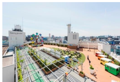
現在の「東急プラザ蒲田」