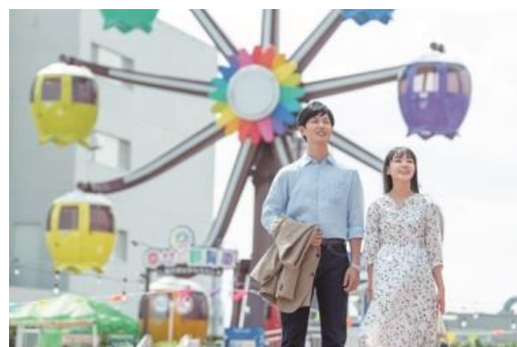
東急プラザ蒲田開業50周年記念制作短編映画 『観覧車の下で会いましょう～人生は観覧車のよう～』

地域からボランティアエキストラを募集し、東急プラザ蒲田をはじめとした蒲田周辺で撮影が行われ、完成した短編映画『観覧車の下で会いましょう～人生は観覧車のよう～』は、11月3日（土・祝）と4日（日）に東急プラザ蒲田屋上「かまたえん」で無料上映されます。