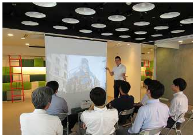
サロン利用イメージ