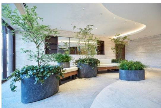
緑に囲まれたベンチのある空間

共用部には内と外との境界を感じさせない植物の自然の流れの中にソファを配置しており、生活の中で植物を見たり触ったり、コミュニケーションが生まれたりする空間にしました。空間に奥行きを持たせることだけでなく、植物を身近に感じさせる仕掛けが本当の狙いです。