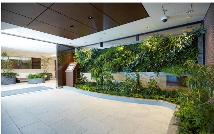
豊富な緑に囲まれた インターフォン

「内と外の境界を感じさせない植物とソファのレイアウトや、壁面緑化に囲まれて配置されたインターフォンがエントランスを緑あふれる快適な空間として演出されている。壁面緑化はその足元にある緑とつながり、不自然さを感じさせない工夫がされている。曲面のコンテナに囲まれたソファは、そこで過ごす中で植物を見たり触ったり、コミュニケーションが生まれる空間になっている。演出力、植物量共に優れた事例として高く評価され選ばれました」