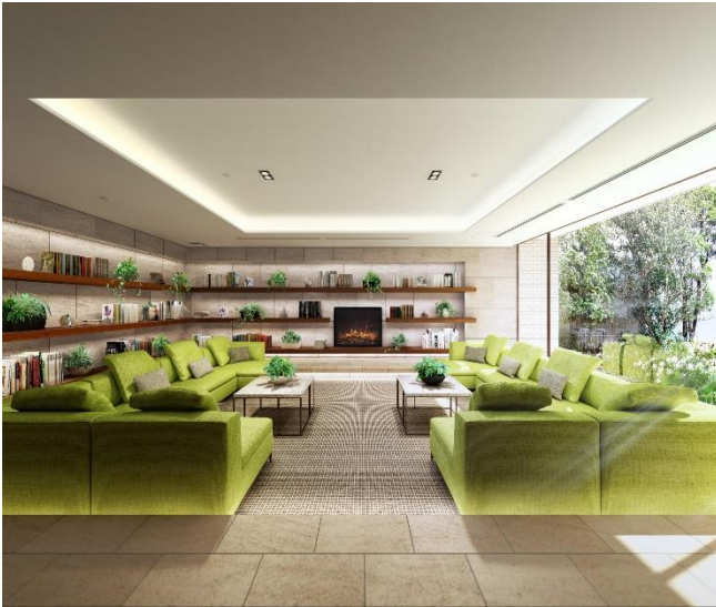
(ラウンジ・完成予想図)

本物件の外観は大きな窓ガラスや異なる厚さのタイル、自然石を組み合わせた外壁などによりスタイリッシュでありながら表情美あふれるデザインを追求しました。また、扁平梁による建築フレームが構造美をなし、大きな開口部を設けることで美しさと居住性を両立した機能美をデザインしています。