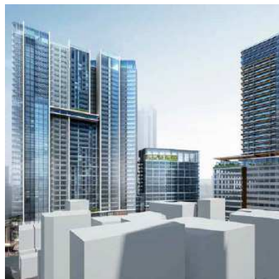
渋谷駅桜丘口地区 第一種市街地再開発事業