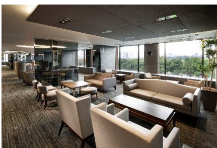
【ビジネスエアポート丸の内】 緑と共存するビジネスラウンジ

また、イベントや共有スペース(シェアワークプレイス)を通じ「共創」を生み出し、お客様のビジネスの成功・飛躍(=TAKE OFF)をサポートしています。