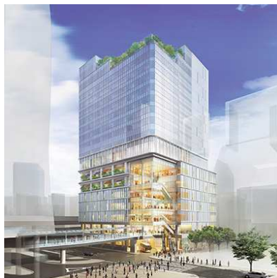
道玄坂一丁目駅前地区 第一種市街地再開発事業

当社は、渋谷駅周辺において新たに3つの大規模プロジェクトを推進し、渋谷のクリエイティブ・コンテンツ産業活性化に向けたまちづくりに取り組んでいます。いずれのプロジェクトにおいてもインキュベーション施設の整備を予定しており、都市計画にて提案した個々のコンセプトに基づき、渋谷のイノベーション創出を加速してまいります。