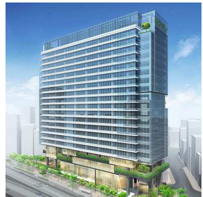
(仮称)南平台プロジェクト