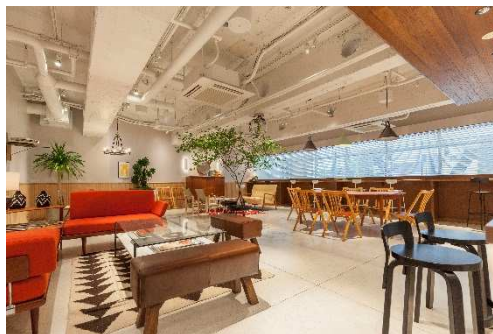
オフィス共用部のコミュニティラウンジ