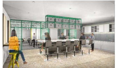
コミュニティスペース(キッチン)