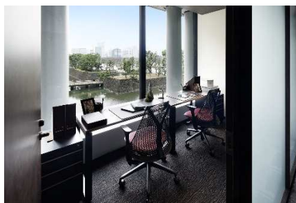
【ビジネスエアポート東京】 皇居に臨む家具付き個室