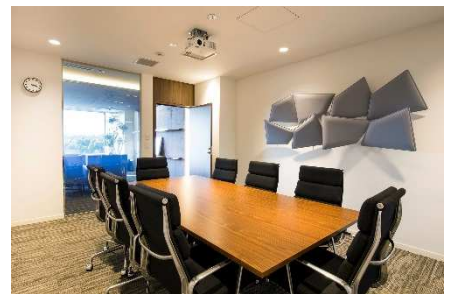
【ビジネスエアポート丸の内】 壁面をホワイトボードとした会議室