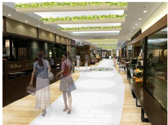
5F 飲食フロアイメージ