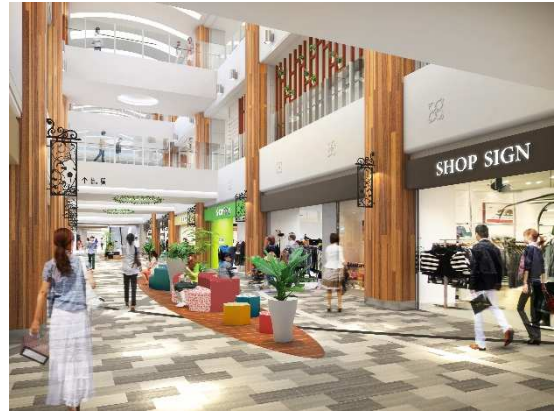
2F メインストリートイメージ