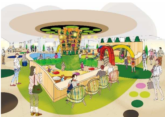
3F ファミリースペースイメージ

3Fには、大規模なファミリースペースを新設します。無料開放の子どもの遊び場に加え、キッズトイレ、ファミリー休憩室、授乳室を併設し、メインターゲットでもあるファミリー層が快適にくつろげる空間づくりをします。また、通路には「けんけんぱ」をイメージしたデザインを施し、子どもの好奇心をくすぐるような仕掛けもご用意します。