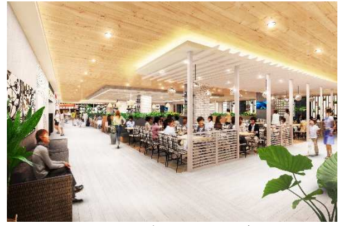
3F フードコートイメージ

リゾート空間の中でお食事を楽しんでいただけるような、内装を施します。また、ファミリーがより利用しやすいよう、小さいお子様と一緒に気軽に過ごせる小上がり席を増設します。