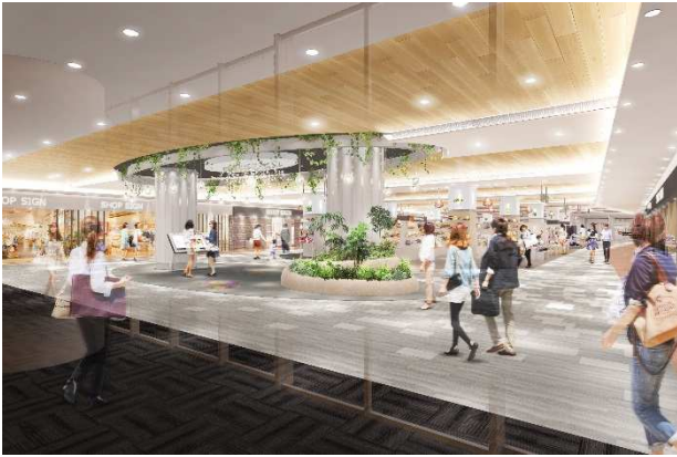
2F メインエントランスイメージ