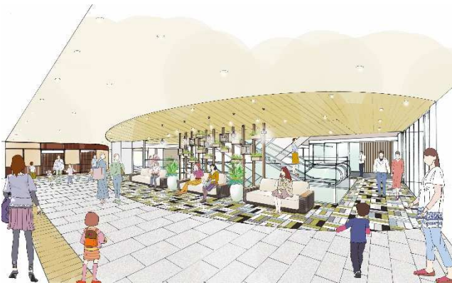
5F レストスペースイメージ