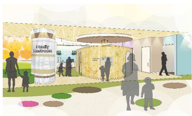
3F ファミリースペースエントランスイメージ