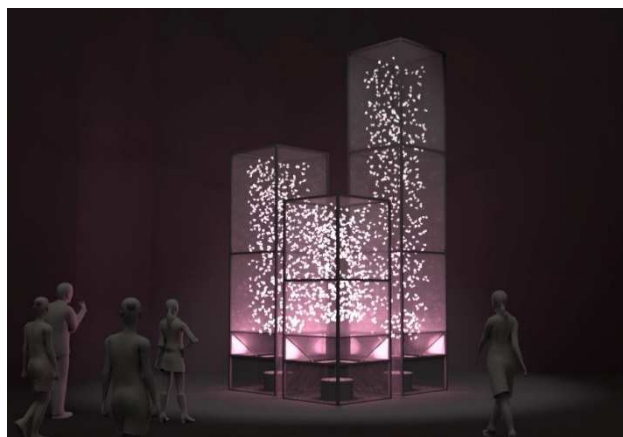
&lt;インスタレーション「BLOOM DANCE」イメージ&gt;

「東急プラザ銀座」は、「Creative Japan～世界は、ここから、おもしろくなる。～」という開発コンセプトのもと、2016年3月31日にオープンしました。全13フロアに、高い格式と最新のトレンドを兼ね備えた、ファッション、雑貨、レストラン、カフェなどの多彩なショップを多数揃え、6階と屋上には自由にくつろいでいただけるパブリックスペースを設け、銀座の街に新たな憩いの場と賑わいを創出し、新しい文化を発信しております。