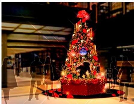
(地下鉄改札側) クリスマスツリー(B2F)

※館内のクリスマス装飾は、それぞれ設置場所の営業時間に準じますが、イベント等の実施により、一部ご覧になれない日がある場合がございます。ご了承ください。