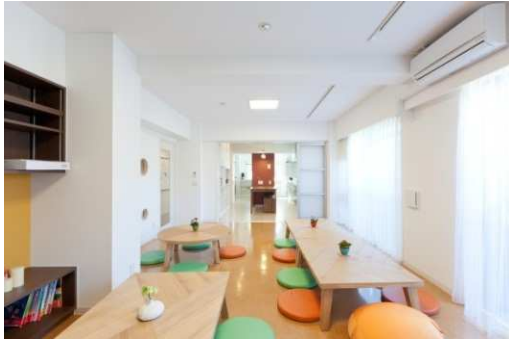
単身者、シングルペアレントが暮らす子育てシェアハウス