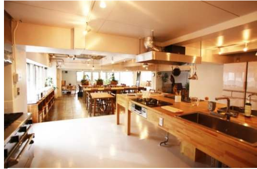
「食」をコンセプトにした単身者向けシェアハウス