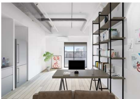
コレクティブハウス住戸 イメージ